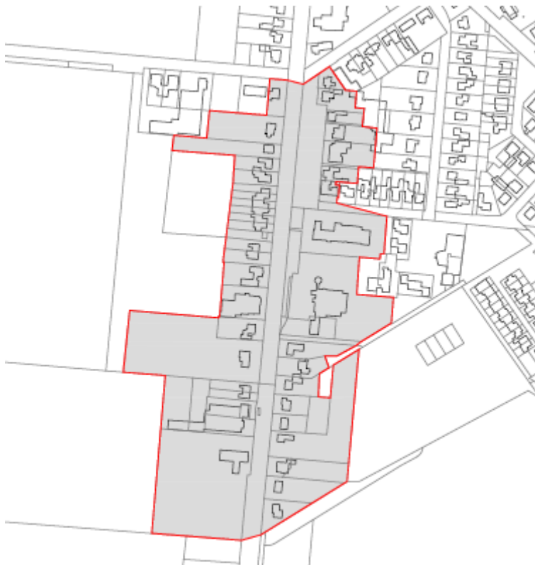
Kern Someren Heide