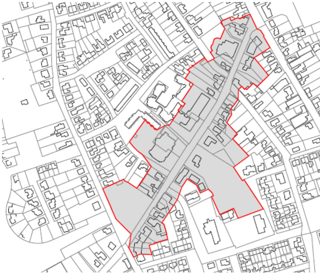
Kern Someren Eind