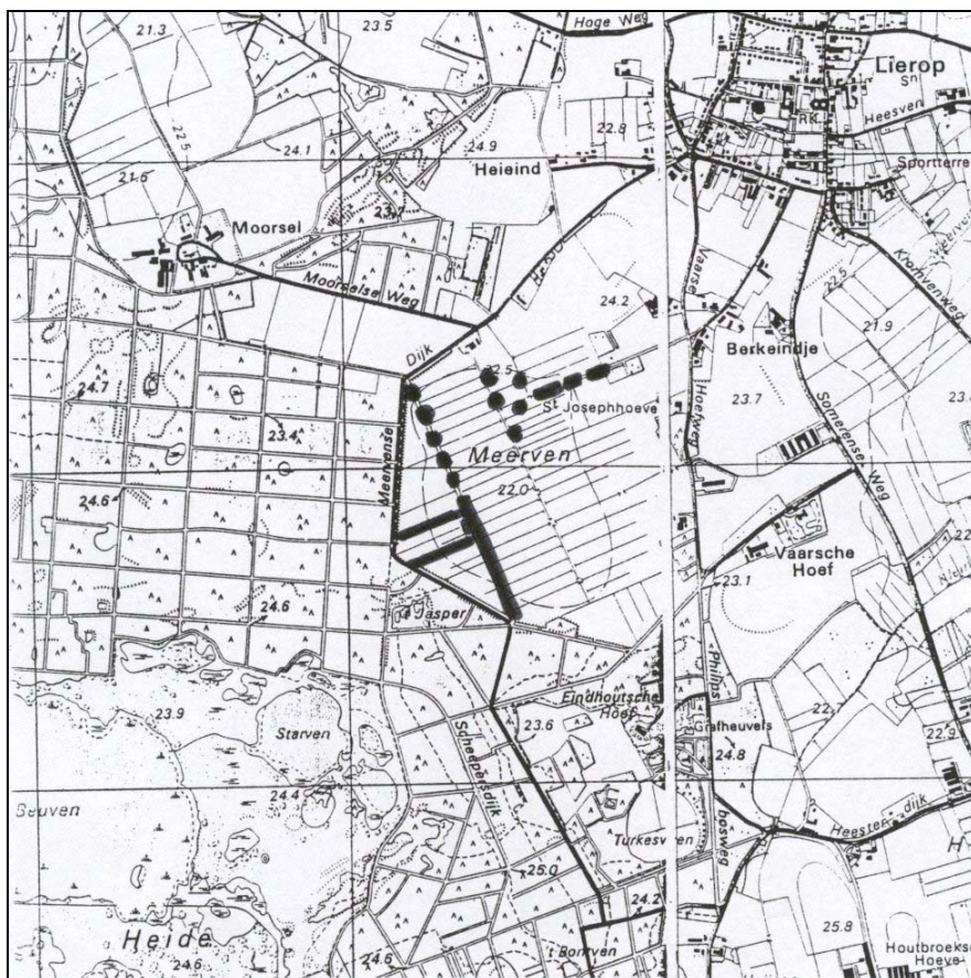
Figuur 4 Actie 7.3