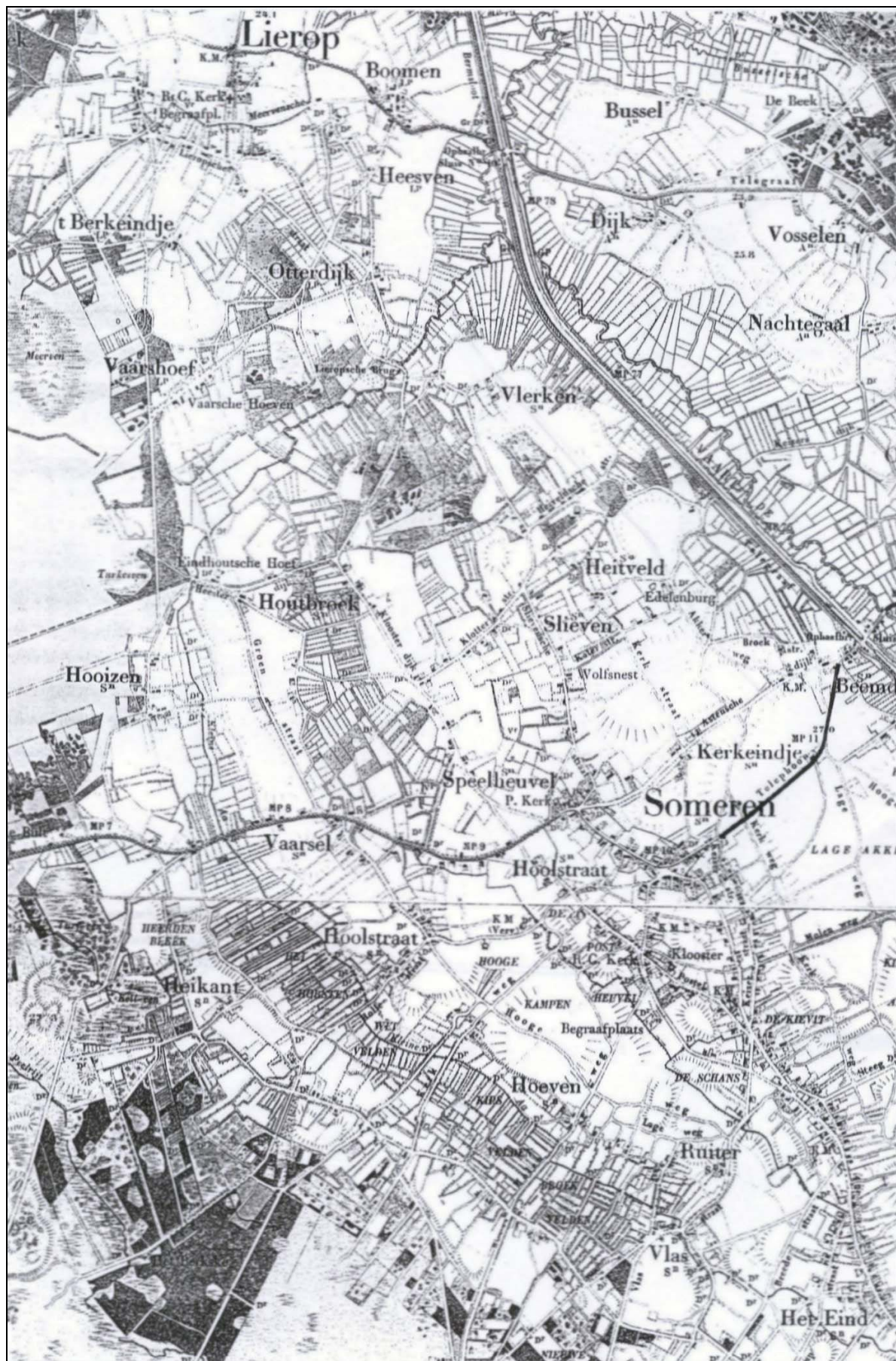
Figuur 2 Situatie 1890