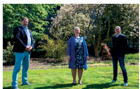
Namens het college van B&W gemeente Someren