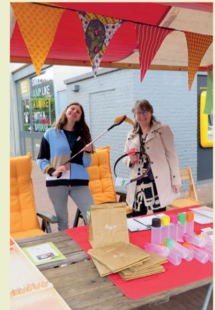
Ons kraampje vorig jaar. Zien we u dit jaar?

Wij wensen de lopers van de Kennedymars veel succes en plezier!