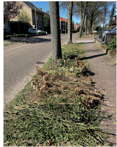
dat hier kosten aan verbonden zijn en neem altijd uw milieupas mee.

Snoeiafval aanbieden bij de milieustraat Heeft u veel tuinafval? Snoeihout en grof tuinafval kunt u ook altijd naar de milieustraat brengen. Houd er rekening mee